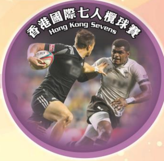
Hong Kong Sevens