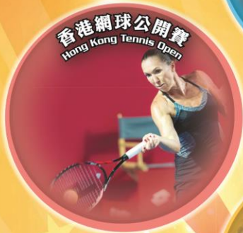
Hong Kong Tennis Open