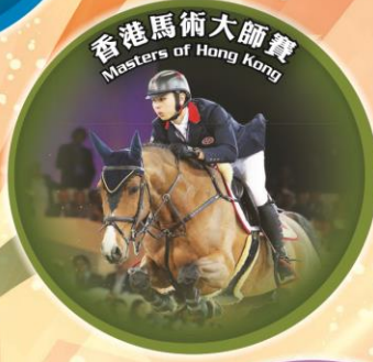
Masters of Hong Kong