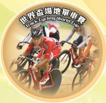
Track Cycling World Cup