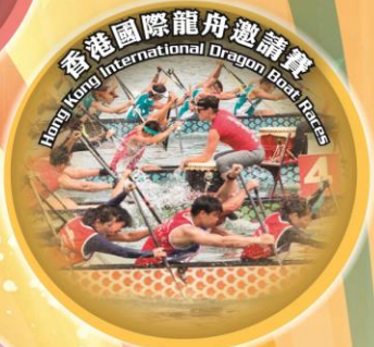
Hong Kong International Dragon Boat Races