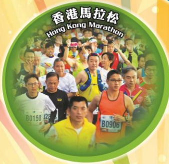
Hong Kong Marathon