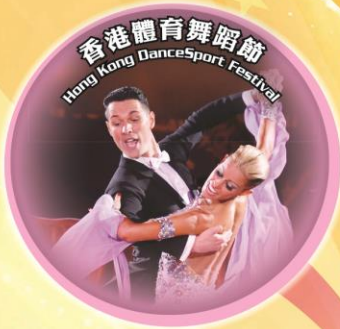
Hong Kong DanceSport Festival