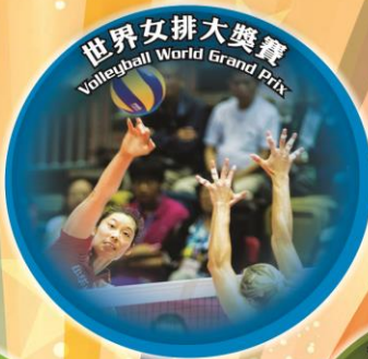
Volleyball World Grand Prix