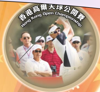
Hong Kong Open Championship