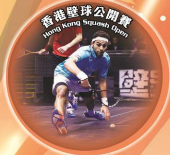
Hong Kong Squash Open